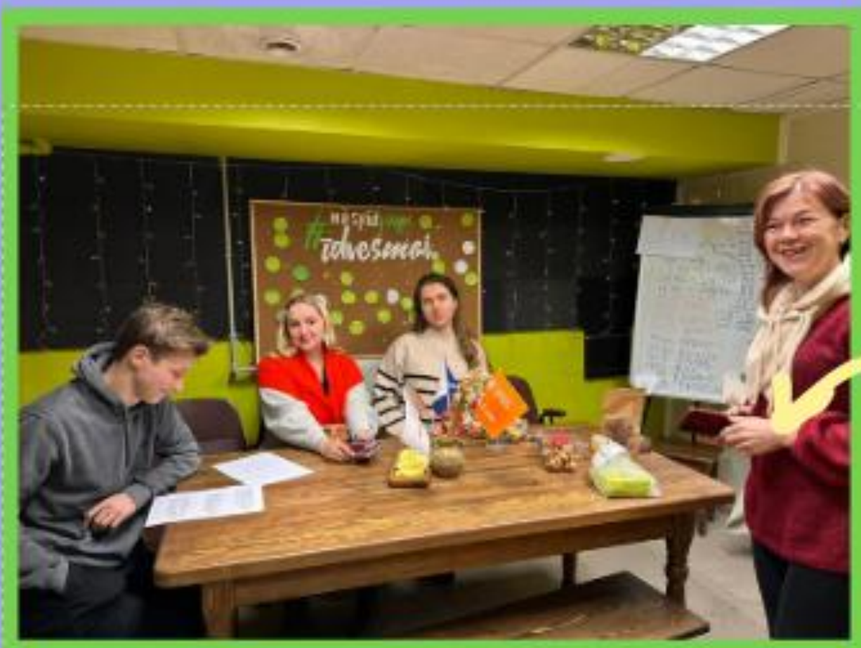
PŪGAS jauniešu telpa (Kārsava)