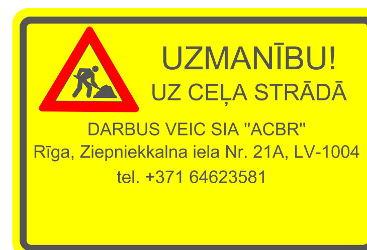
- Būvniecības brīdinājuma plakāts