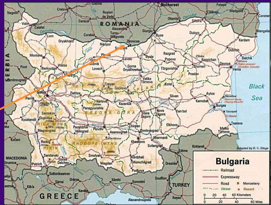
Partnerības reģions 2