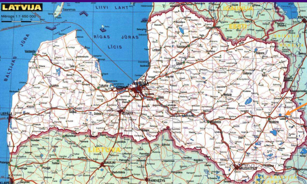
Partnerības reģions 1