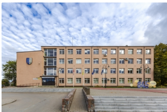
Ludzas novada pašvaldība (Raiņa iela 16, Ludza)