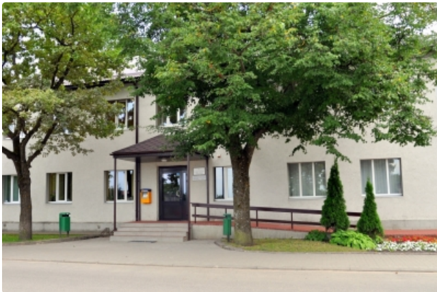
Ludzas novada pašvaldība (Raiņa iela 16A, Ludza).